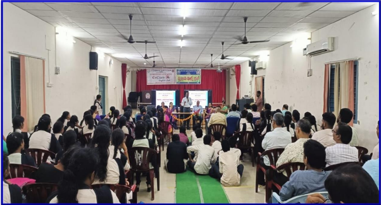
PRINCIPAL, VICE-PRINCIPAL, SRUJANA & ENCORE CLUBS COORDINATORS