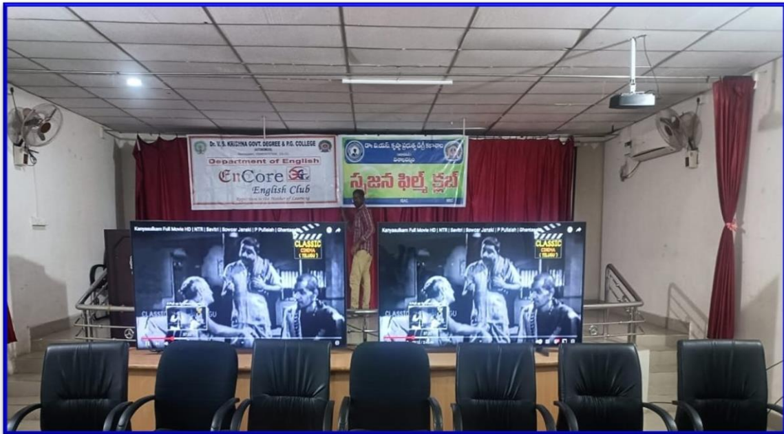
SCREENING OF THE MOVIE-KANYASULKUM