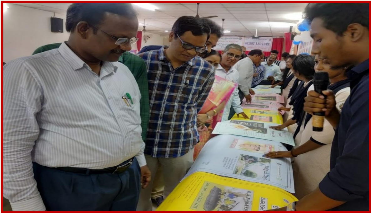
POSTER PRESENTATION BY ENCOREANS