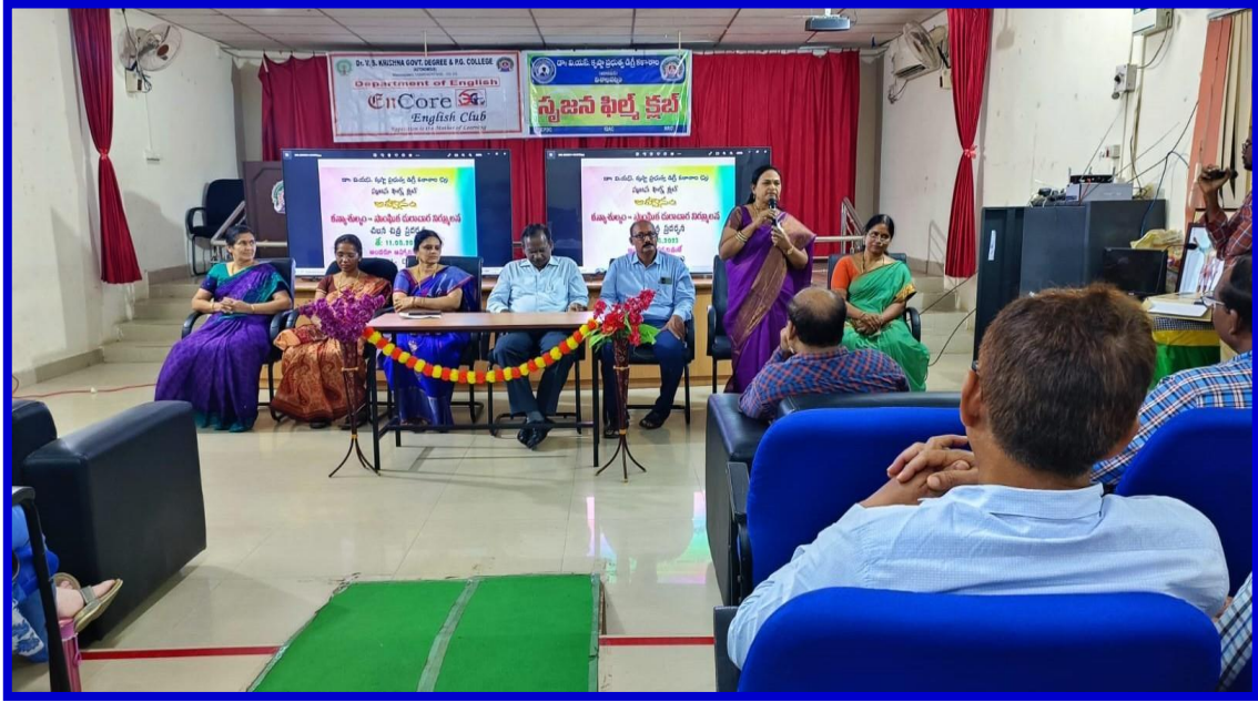
ENCORE CLUB COORDINATOR ADDRESSING THE GATHERING