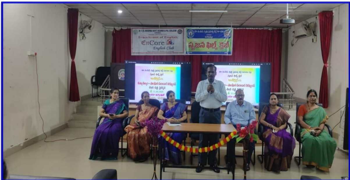
PRINCIPAL ADDRESSING STUDENTS