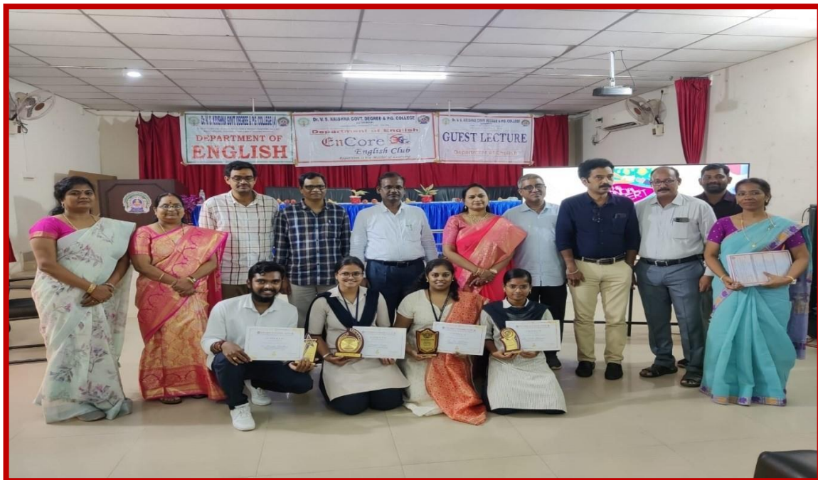
BEST ENCOREANS OF THE YEARS AWARDS